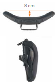
Oparcie Jay 3 Średni kontur