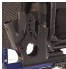
Oparcie z regulacją kąta