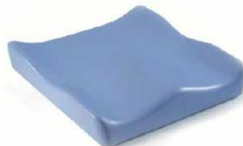
Jay Soft Combi P (zdjęcie nie pokazuje tapicerki)