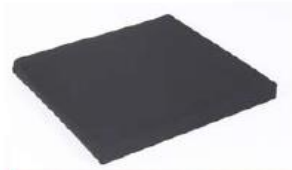
Poduszka na siedzisko z czarnym pokrowcem na suwak