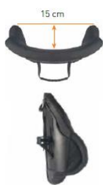
Oparcie Jay 3 Środkowy głęboki kontur