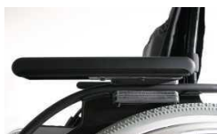
Podłokietnik z reg. wysokości przy pomocy narzędzi