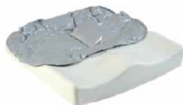
Jay Easy Fluid (zdjęcie nie pokazuje tapicerki)