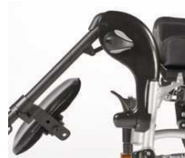
Unoszone ramię podnóżka