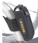
Kieszonka na telefon