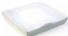
Jay Basic (zdjęcie nie pokazuje tapicerki)