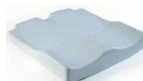
Jay Easy Visco (zdjęcie nie pokazuje tapicerki)