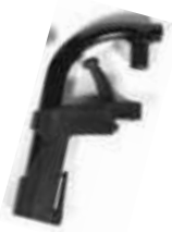
Plastikowe ramię podnóżka