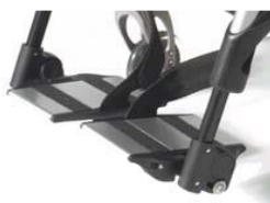
Aluminiowe podzielone platformy podnóżka z reg. kąta i głębokości