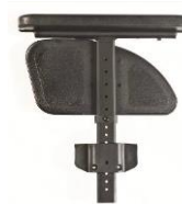
Podłokietnik na słupku z reg. wysokości przy pomocy narzędzi