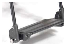
Aluminiowa platforma z reg. kąta i głębokości, podnoszona