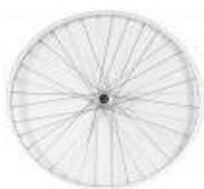
Uniwersalne koło ze splotem krzyżowym