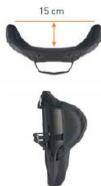
Oparcie Jay 3 Głęboki kontur