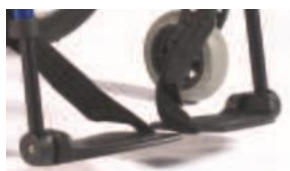
Podzielone plastikowe platformy podnóżka z reg. kąta