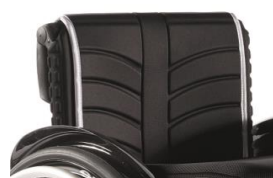
LII030316 Tapicerka EXO standardowa