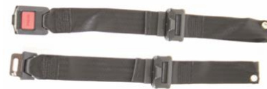
Pas pozycjonujący ze sprzączką