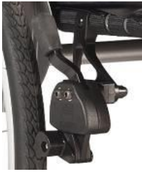
Hamulec z dźwignią na wys. kolan