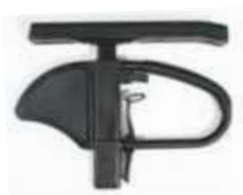
Podłokietnik na słupku z reg. wysokości