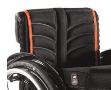
LII030317 Tapicerka EXO PRO oddychająca