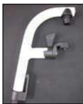
Aluminiowe ramię podnóżka