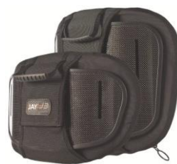
Oparcie Jay 3 Carbon płytki kontur