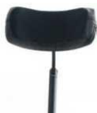
Zaglówek z reg. wysokości, głębokości i kąta