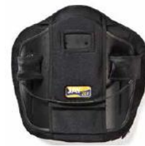
Oparcie Jay Zip