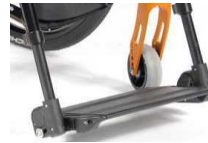
Platforma aluminiowa, z reg. kąta, składana na bok, czarna