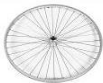
Koło z polerowaną piastą, 36 szprych, splot prosty