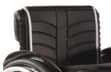
Tapicerka EXO standardowa