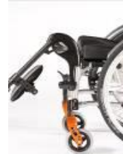
Unoszone ramię podnóżka (ELR)