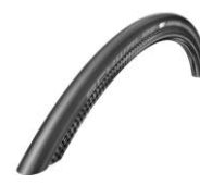
Opona pneumatyczna, Schwalbe One