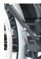
Hamulec jednoręczny, prawy