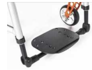
Platforma lekka, plastikowa, z reg. kąta i głębokości