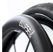
Ellipse 3R Handrim