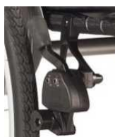
Hamulec na wys. kolan