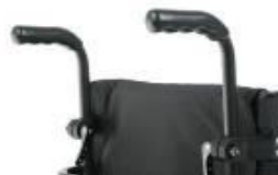
Uchwyt z regulacją wysokości