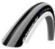
Opona pneumatyczna, gładki bieżnik, Schwalbe