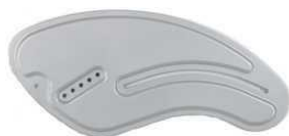
Aluminiowa osłona boczna (w kolorze ramy)