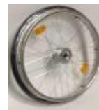
Koło z ham. bębnowym, 36 szprych, splot krzyżowy