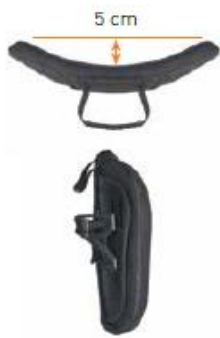
Oparcie Jay 3 płytki kontur