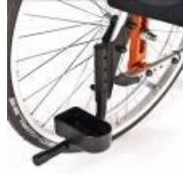
Uchwyt na kule