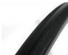
Opona odporna na przebicia