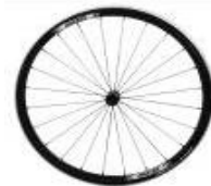
Koło Proton, 24 szprychy, splot prosty