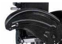
Osłona boczna z włókna węglowego z błotnikiem (czarna)