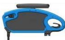
Podłokietnik przystolikowy ze stałą wysokością