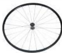
Koło lekkie, 24 szprychy, splot prosty