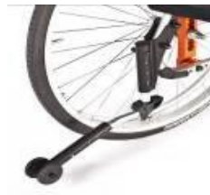
Kółko antywywrotne, odchylane, lewe