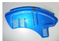
Aluminiowa osłona boczna z błotnikiem (w kolorze ramy)