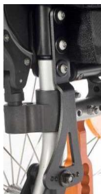
Oparcie z reg. kąta