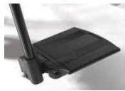
Dzielone podnóżki aluminiowe, z reg. kąta, składane na boki, czarne