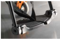
Dzielone podnóżki plastikowe, z reg. kąta, składane na boki, czarne