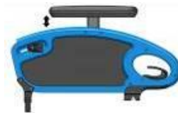
Podłokietnik przystolikowy z reg. wysokości