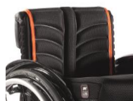
Tapicerka EXO PRO oddychająca