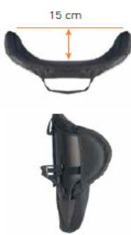
Oparcie Jay 3 głęboki kontur