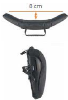
Oparcie Jay 3 średni kontur