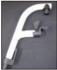
Aluminiowe ramię podnóżka 110°/100°