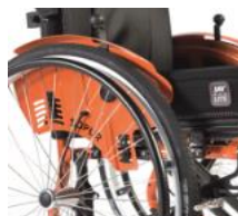
Hamulec zintegrowany z osłoną boczną, Safari