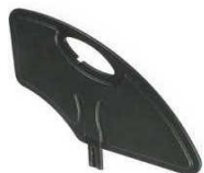
Plastikowana zdejmowana osłona boczna (czarna)