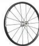
Koło Spinergy, 18 szprych, splot prosty