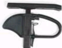
Podłokietnik na słupku z reg. wysokości