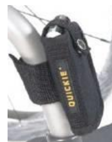
Kieszka na telefon