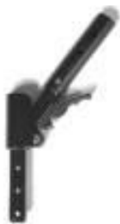
Oparice składane w połowie, do tyłu