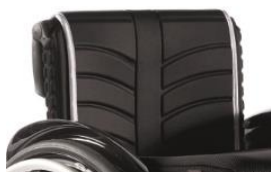
Tapicerka EXO standardowa