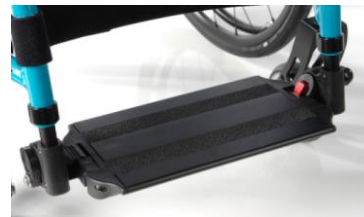
Platforma aluminiowa, z regulacją kąta i głębokości z systemem blokującym dla użytkowników ze spastycznością