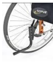
System wspomagający przy przechylaniu