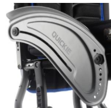
Osłona boczna aluminiowa z błotnikiem