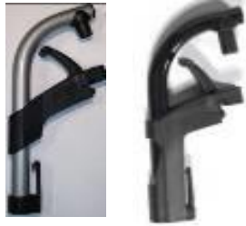
Uchwyty podnóżka 70°/80°