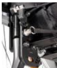
Oparcie składane z regulacją kąta, po złożeniu