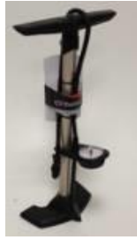
High pressure pump