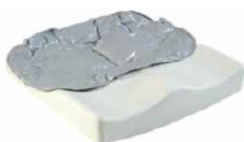
Jay Easy Fluid (na zdjęciu bez pokrowca)