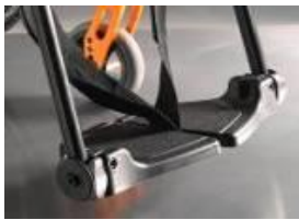
Dzielone, kompozytowe podnóżki