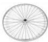
Koło z polerowaną piastą