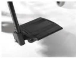
Dzielone, aluminiowe podnóżki