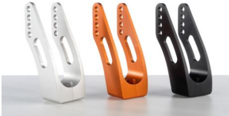
Widelce aluminiowe srebrny, pomarańczowy, czarny