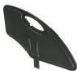
Kompozytowa odczepiana osłona boczna