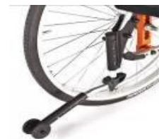
Kółko antywrotne odchylane