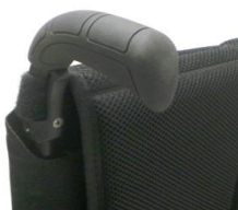
Długie rączki do prowadzenia