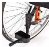
Uchwyt na kulę