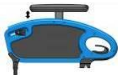
Podłokietnik stolikowy w regulacji wysokości z poduszką 250 mm)