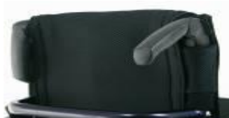
Składane rączki do