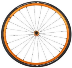
Lightweight wheel, anodized orange