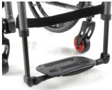
Lekka kompozytowa platforma podnóżka z regulacją kąta i głębokości