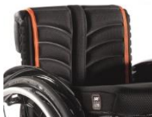
Tapicerska EXO PRO