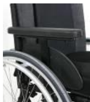
Podłokietnik na jednym słupku z regulacją wysokości