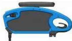
(Podłokietnik stolikowy ze stałą wysokością z poduszką 250 mm)