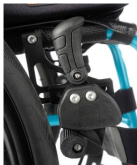
Dźwignia blokady na wysokości kolan