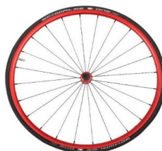
Lightweight wheel, anodized red