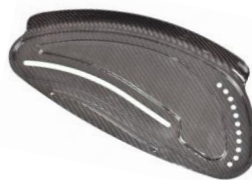
Osłona boczna z włókna węglowego z błotnikiem