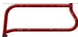
Life FF 85°