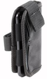
Mobile phone pocket