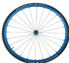
Lightweight wheel, anodized blue