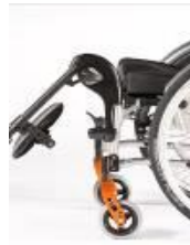
Podnoszony uchwyt podnóżka