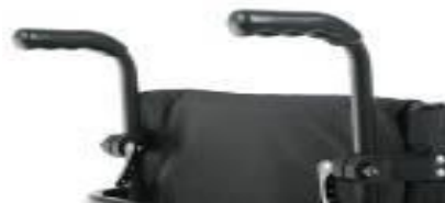
Rączki do prowadzenia z regulacją wysokości